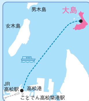
JR 高松駅 高松港 ことでん高松港駅

入所者には目の障害のある方が多いため、島内には、分かれ道や建物が分かるように音楽が流れ（盲導鈴）、歩行の手がかりになる白線（盲導線）や柵（盲導柵）が設置されています。