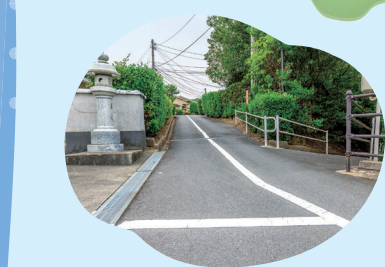
盲導鈴・盲導線・盲導柵

開園以来、大島で2千人を超える入所者が亡くなっています。納骨堂には6月現在で2,122人の遺骨が納められています。