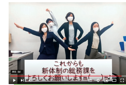
YouTubeには新入社員紹介や部署紹介などを掲載