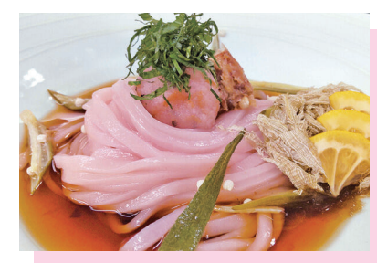
自社製ヘルシー麺「梅の米粉麺」