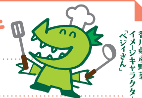
香川県産野菜「ベジィさん」