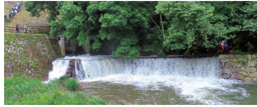
放水口から勢いよく流れ出る満濃池の水

その日の式に、幕末から明治維新にかけて、この満濃池を復興した先人のご子孫の方が参加されておられました。その方々から復興の物語をお