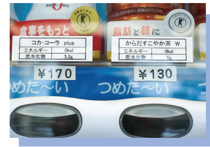
社内の自動販売機にカロリーなどを表示