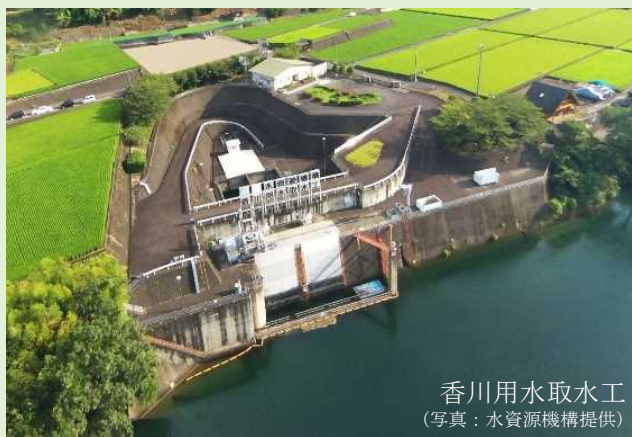
香川用水取水工