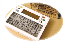
携帯用会話補助装置