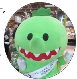
香川県産野菜イメージキャラクター ベジィさん