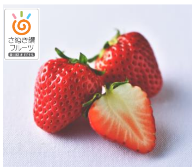
さぬき讚フルーツ 「いちご（さぬきひめ）」