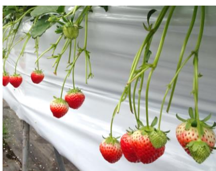
収穫時期を迎えた 「いちご（さぬきひめ）」