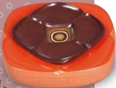
音丸耕堂 堆漆柿香合

器物に各種の色漆を数十回から数百回塗り重ね色漆の層（100回で厚さ約3mm）を作り、その層を掘り下げることによって文様を浮き彫りにする技法