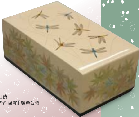
太田儔 籃胎蒔醬箱「風薫る頃」