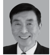
自由民主党公認候補