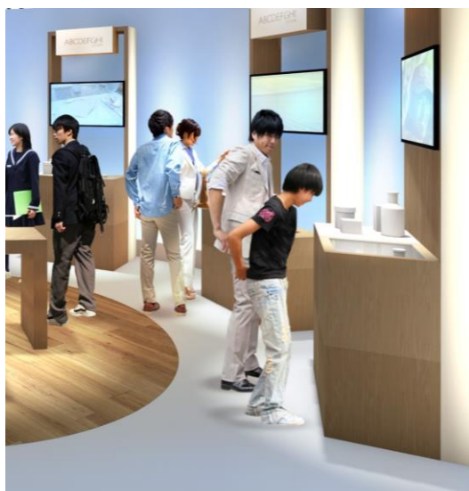
取組み成果の展示のイメージ

https://www.expo2025.or.jp/sponsorship/future/#sec1