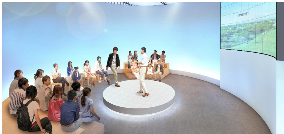
取組み成果のステージ発表のイメージ