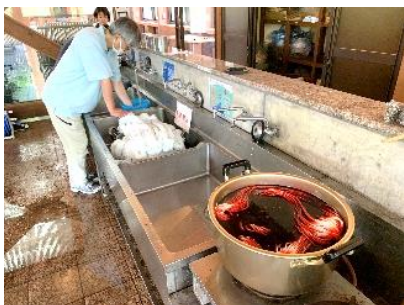
《そらあみ》の糸を染める