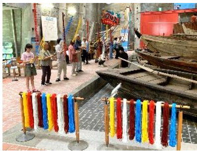
一般参加のワークショップ（7月22日）