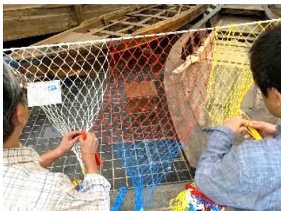
展示に向けて網をつなげていく