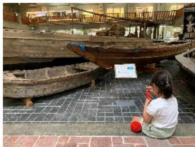
子どもたちもできることを体験