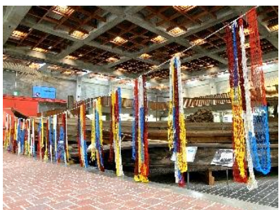
帯状に編み進んだ《そらあみ》