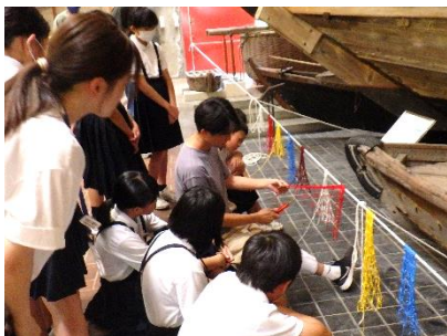
小学生のワークショップ（6月29日）