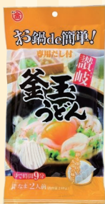
株式会社マルキン (観音寺市)