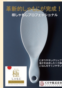
くりや株式会社 (さぬき市) ブースNo 13

ダンボール製の獅子の頭とゆたんを組み合わせてオリジナルの獅子が作れます。他にも、ダンボール製グッズをご用意。