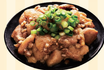
株式会社まんでがん (善通寺市)