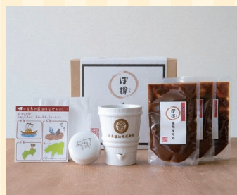
丸島醤油株式会社 (小豆島町)