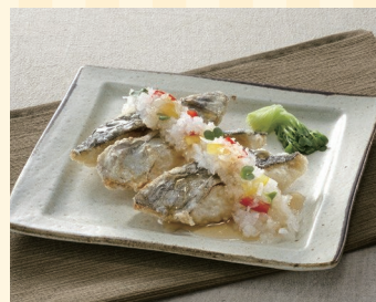
株式会社八粟 (高松市)