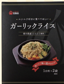
宝食品株式会社 (小豆島町) ブースNo 12

マカロンは6種類の味をご用意。好みのフレーバーをお楽しみいただけます。グルテンフリー専門店です。