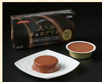
株式会社ルーヴ (高松市)