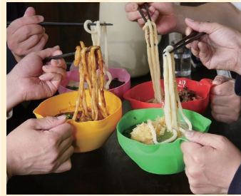
松浦産業株式会社 (善通寺市) ブースNo 10

独自製法で作ったカップこんにゃく麺。コクがあってまろやかな牛だしがやみつきになります。