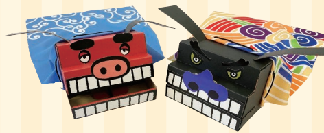
株式会社グッドワーク (三木町) ブースNo 3

どんな所でもどんな環境でも自立して立つ、ふしぎな棒。どのように使ってどう活かすかは、あなた次第です。