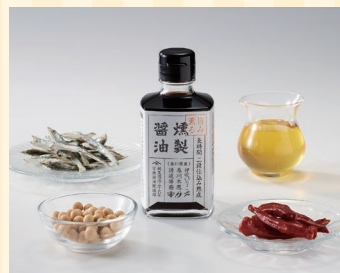
有限会社宮地醤油 醸造場(高松市)

うどん、骨付鳥に続く第3の香川名物。高松のB級グルメ。鶏肉をバター、塩胡椒、ガーリックパウダーで炒め醤油で風味付けした料理。