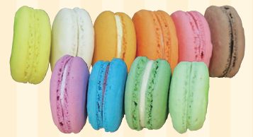
株式会社スミダ・リ・オリジン (高松市) ブースNo 7