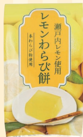
丸金食品株式会社 (小豆島町)