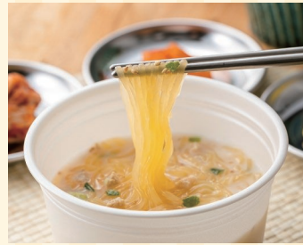
ハイスキー食品工業株式会社 (三木町) ブースNo 8

琴平町産にんにくを使用。1合用が2袋入。混ぜごはんでも、炒めごはんでも食べ方が選べます。