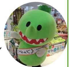
香川県産野菜イメージキャラクター ベジィさん