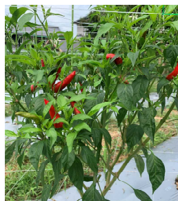
「香川本鷹」栽培ほ場