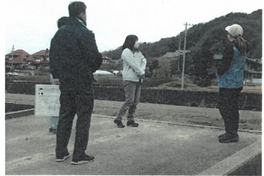
サポートチームによる新規就農者への支援

また、定期的にサポートチームで新規就農者を訪問し、問題点の聞き取りなどを行うとともに、助言や指導を行った。