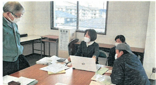
税理士から税務に関する指導を受ける

また、就農後、新規就農者が抱える様々な課題に対して税理士や社会保険労務士などの専門家へ相談することで、課題解決の糸口となり、新規就農者から認定農業者への移行など、次のステップに向けた動きにつながった。