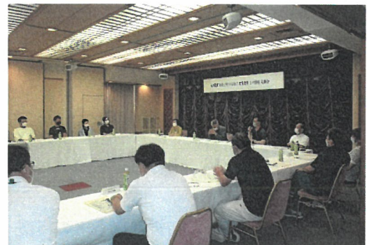
農業士と新規就農者等との意見交換会

地区の模範となる先輩農業者である大川農業士会と連携して、7月に農業士と新規就農者(就農希望者含む)との意見交換、11月には農業士が新規就農者のほ場に出向き助言を行うサポート支援(ステップアップセミナー)や、新規就農者が農業士の経営を学ぶ研修会を開催し、新規就農者の栽培技術向上と経営安定の支援を行った。