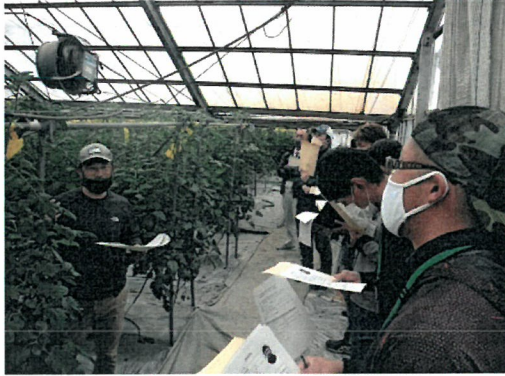
ステップアップセミナーで先輩農業者の経営について学ぶ

普及センターが主催する新規就農者向けの研修会「ステップアップセミナー」やGAP研修会のほか、税理士などの専門家による相談会などの開催について情報提供を行い、スキルアップや経営改善に向けて参加を促した。