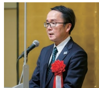
御来賓挨拶（池田県知事）