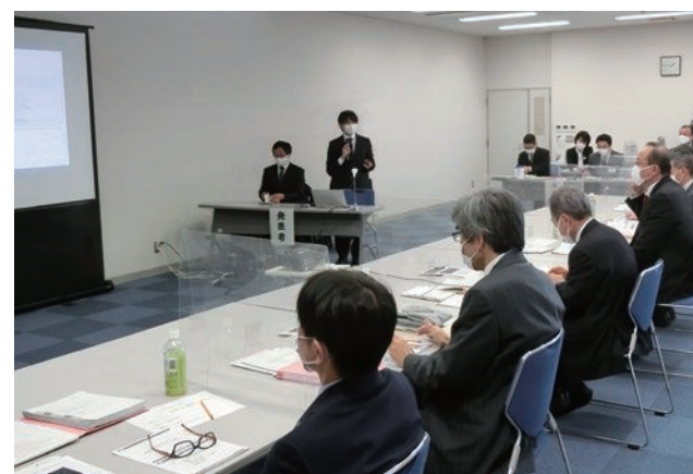
芦原科学賞選考委員会での審査の様子