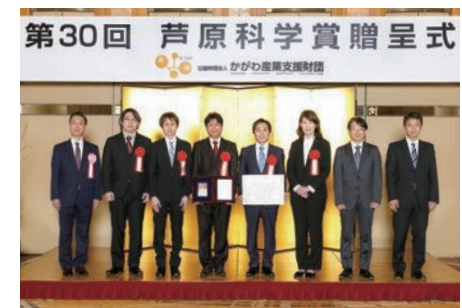
大賞受賞者の皆様