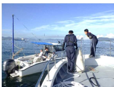
海上での周知活動