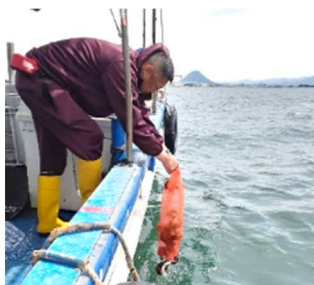
R6.5.2 抱卵イイダコ放流