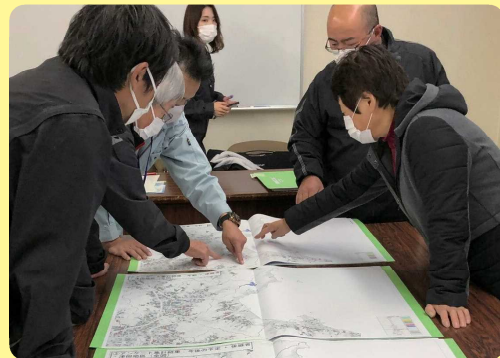
現況地図を使った話し合い

目標地図とは、将来の地域の農地利用について、一筆ごとに誰が耕作するのかを明らかにするものです。将来の農地利用を地域ぐるみで考え、だれが耕作するのか、目標地図にまとめて、見える化し、実行する必要があるのであります。