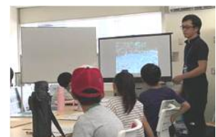
・スライドを見ながら現状を知る