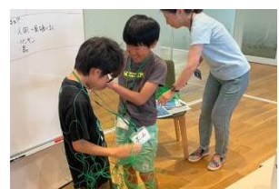
・からまりの体験