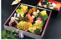
1日目[夕食] せんせいのおべんと