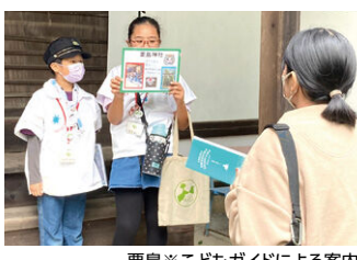
粟島※こどもガイドによる案内