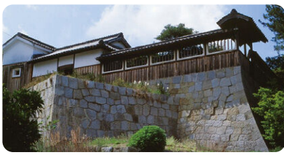
広島 尾上邸(日本遺産構成文化財)

出発日 2024年10月5日(土) 料金 高松駅/坂出駅発着(バス利用有り) 10,000円 丸亀港発着(バス利用なし) 9,000円