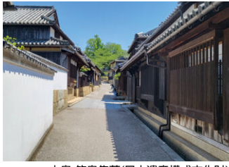
本島 笠島集落(日本遺産構成文化財)