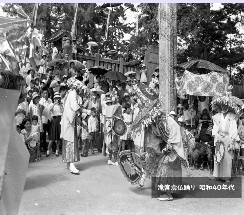
滝宮念仏踊り 昭和40年代