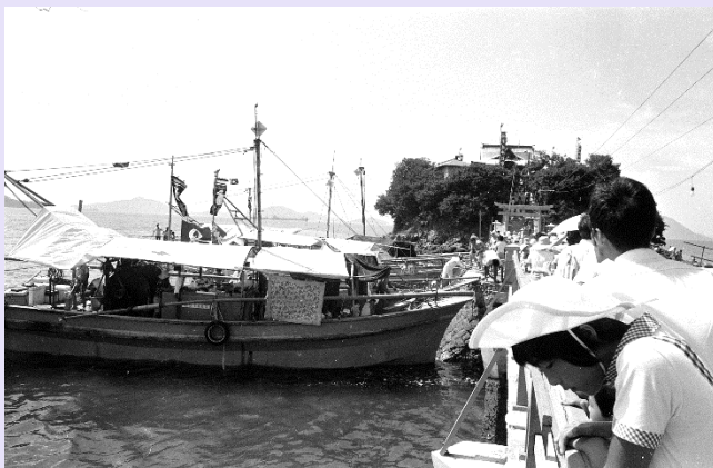
津嶋神社の夏季例大祭 昭和49年頃