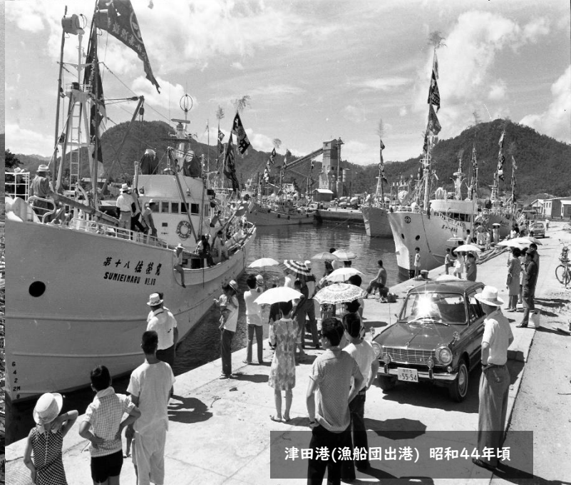
津田港(漁船団出港) 昭和44年頃