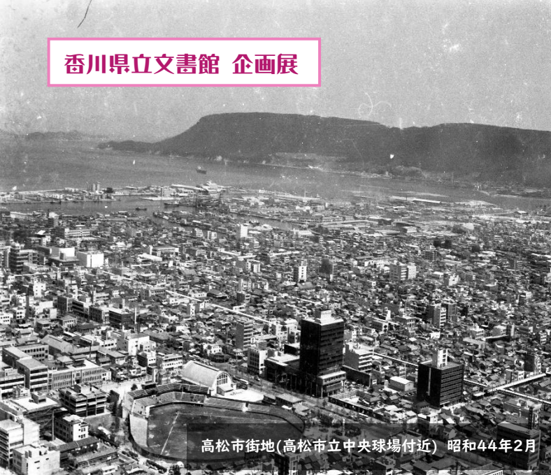
高松市街地(高松市立中央球場付近) 昭和44年2月