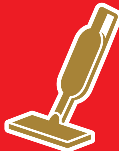
ハンディクリーナー