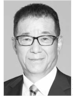
代表 松井 一郎