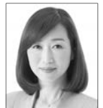
党首 釈 量子 しやく りょうこ