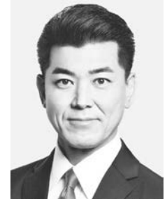
立憲民主党 代表 泉 健太