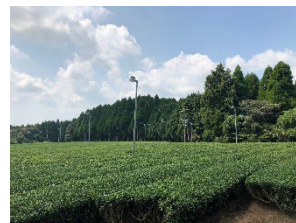
オーガニック茶畑