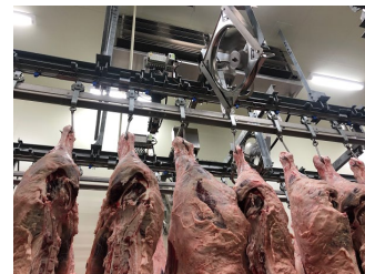
対米・EU向け牛肉加工施設