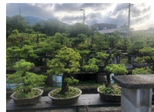
EU輸出対策済み棚上げ盆栽