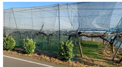
ベトナム輸出対策済みナシ畑