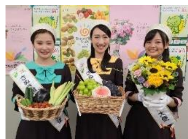
「さぬき讚サンはなやか（花野果）大使」

※上記以外の「旬の県産農産物」 らりるれレタス、ロメインレタス、サニーレタス、ブロッコリー、さぬきひめ、富有柿 ほか