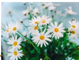
さぬき讚フラワー 「マーガレット」