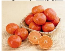
さぬき讚フルーツ 「小原紅早生」