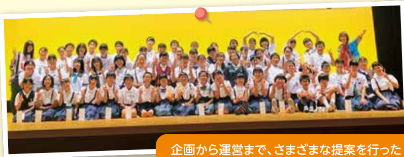
企画から運営まで、さまざまな提案を行った小・中学生実行委員のみなさん