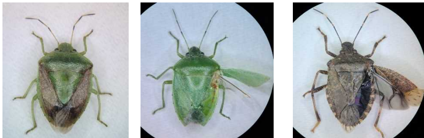
第1図 果樹を加害するカメムシ類 (左からチャバネアオカメムシ、ツヤアオカメムシ、クサギカメムシ)