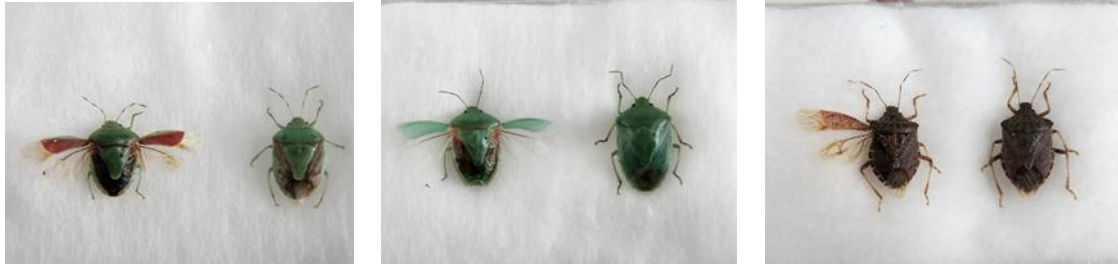
第1図 誘殺数の多い果樹カメムシ類 (左からチャバネアオカメムシ、ツヤアオカメムシ、クサギカメムシ)