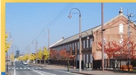
赤レンガの旧兵器庫は、総本山善通寺の南大門から伸びる道沿いにあります。