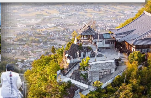
第73番札所 出釈迦寺奥之院 …空海が7歳のときに身を投げたところ、お釈迦様が救済したという伝説が残るお寺。