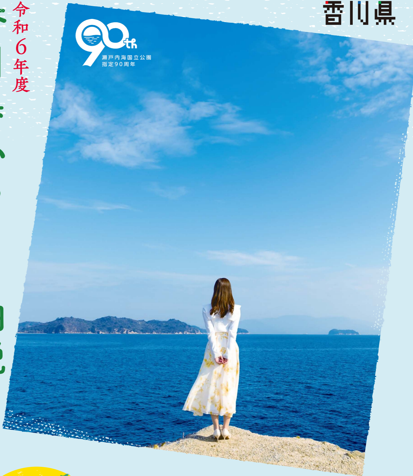
瀬戸内海国立公園指定90周年 長崎の島(屋島)から瀬戸内海を望む