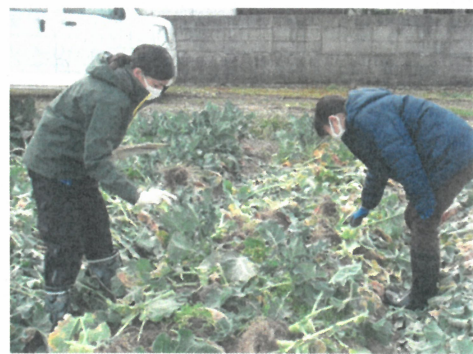
農業試験場との発生ほ場調査

また、薬剤防除では効果が不十分な激発ほ場におけるブロッコリー生産に関して、転炉スラグの施用の事例が管内では無かったことから、実証ほを設置し、同資材の防除効果を検証するとともに、対策に苦慮している生産者に向けて普及に取り組んだ。