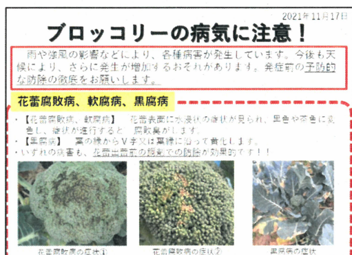
図-2 防除を呼びかけるチラシ (普及センター作成)

が開始されて以降は、集荷場で定期的に実態調査を行い、集荷場担当者との情報交換を通じて病害の発生状況を把握・共有するとともに、被害が大きくなっている病虫害や被害が予想される病害については、防除の徹底を呼び掛けるチラシを作成し、集荷場に掲示を行うことで時期を失しない防除を意識づけた。