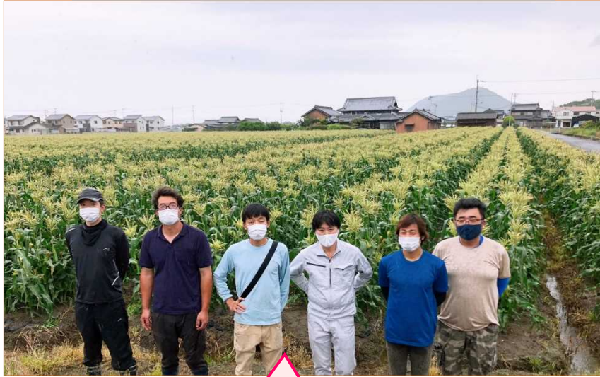
洋菜部会の皆さん

今回は、坂出市松山の洋菜部会がおこなった、収穫前の生育確認巡回に同行させていただきました。