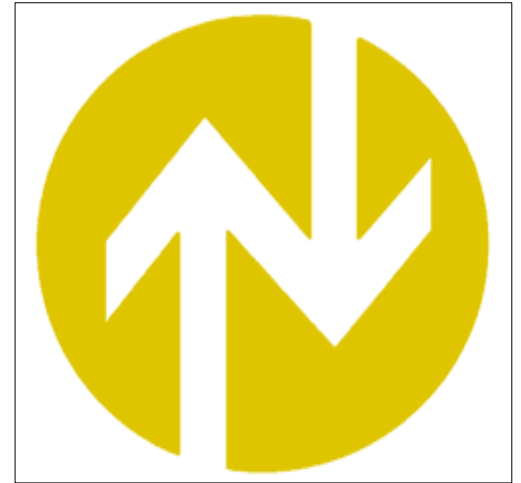
定期検査報告済マーク

建築基準法第12条に基づいた制度で、日常、多くの人々が利用するエレベーター、エスカレーターやコースター、観覧車などを、安全で安心なものとして信頼され使用して頂くため、所有者・管理者の方々が、専門的な知識をもった検査資格者（昇降機検査資格者）による定期的な検査を行い、その結果を所轄特定行政庁に報告頂くよう、法律で義務付けられたものです。