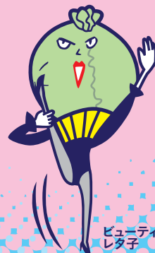
ビューティフルレター