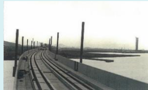
本四備讃線（宇多津方面を望む）