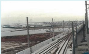
本四備讃線（瀬戸大橋方面を望む）

今回は当時を物語る写真や地図など地域資料もあわせて展示しますので、これらの豊かなアーカイブズ群を通して時代の懐かしさも感じていただければと思います。