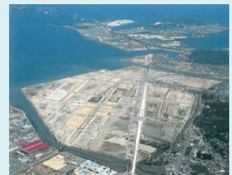
整備が進む新宇多津都市(広報香川 61年10月号より)