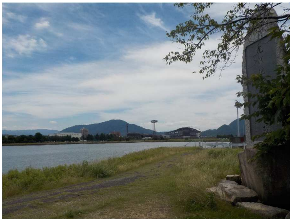
先代池北堤と丸亀競技場

平成9年(1997年)にはスポーツセンターに隣接して香川県立丸亀競技場が、平成27年(2015年)には先代池の西側に丸亀市民球場が完成するなど、時代の遷り変りとともに先代池とその周辺の環境も大きく変化し、市民などの競いの場・憩いの場として活用されています。