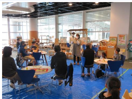
▲かがわの森アンテナショップ (木工工作イベント)