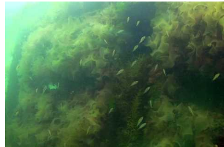
▲藻礁に繁茂する海藻とい集するメバルの稚魚

水産基盤整備事業により、県内の浅海域の適地にコンクリート製ブロックを設置するなど、多くの魚介類の重要な産卵場、幼稚魚の育成場となっているガラモ場を造成しました。