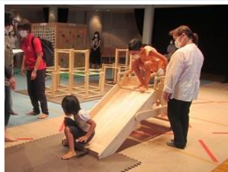
▲モクモクおもちゃ広場の開設状況