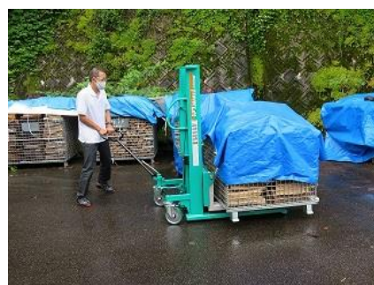
▲ 薪生産拠点への支援