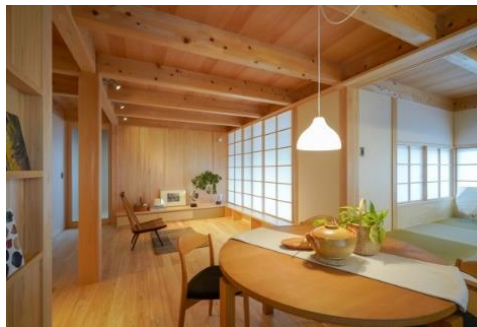
▲県産ヒノキを利用した住宅