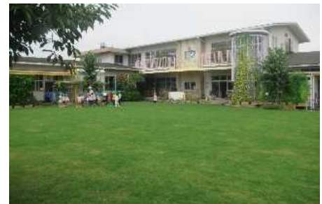
▲私立保育園での芝生化