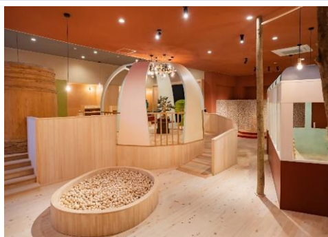
▲県産木材を利用した民間施設