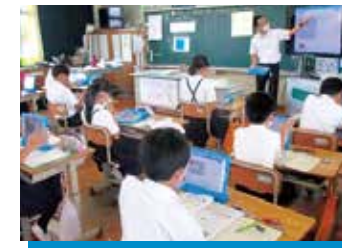
香川型指導体制の推進

基本理念を実現するため、7つの重点項目を定め、それぞれの基本的方向を踏まえ、計画的・総合的に取組みを展開していきます。