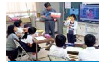
歯・口の健康づくりの学習