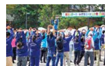
第30回県民スポーツ・レクリエーション祭