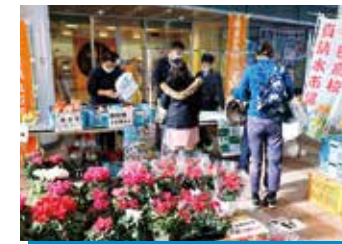
かがわ産業教育フェア