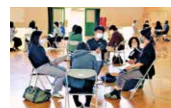
家庭教育推進専門員によるワークショップ