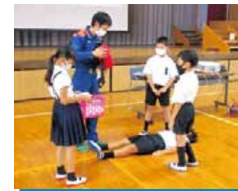
「いのちのせんせい」派遣事業