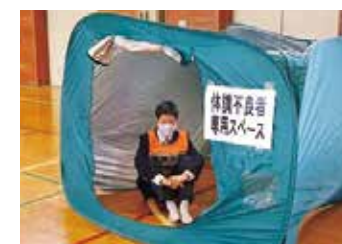
高校生が避難所運営を体験