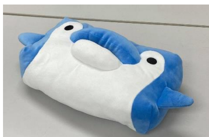
ことちゃんティッシュケース