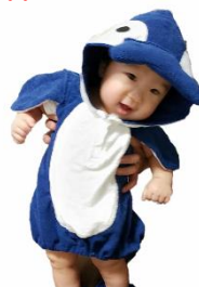
ことちゃんベビー服