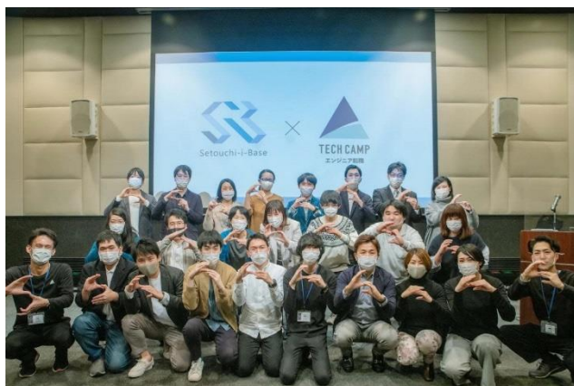
令和2年度「かがわコーディングブートキャンプ」最終課題発表会の様子

受講者の中には、コーディネーターの支援のもと、「かがわコーディングブートキャンプ」で身に着けたスキルを活かし、フリーランスとして活動を始めた方もいます。