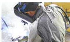
金属ものづくり科