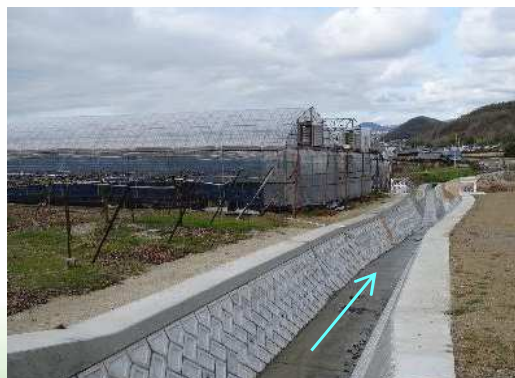
西谷川 河川改修事業 【普通寺市】普通寺市吉原町(小河川における河川改修)