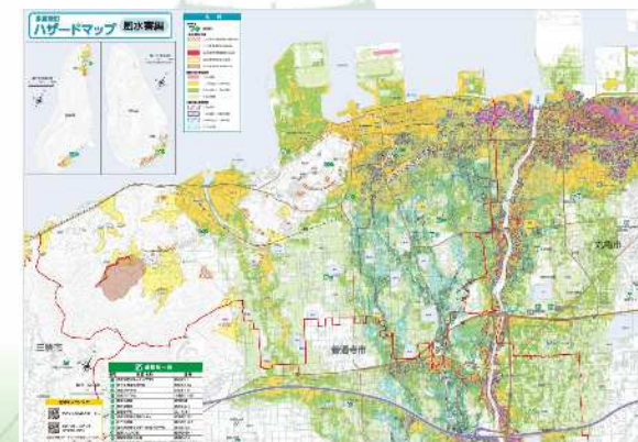
多度津町 ハザードマップの改良 【多度津町】