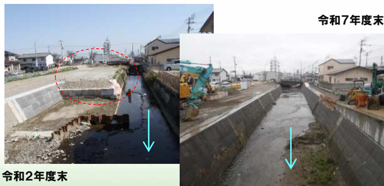
桜川 河川改修事業 【県】多度津町(護岸整備等による河川改修)