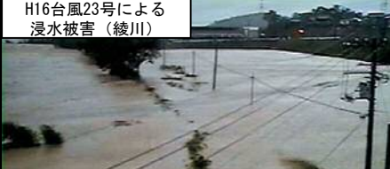
H16台風23号による 浸水被害(綾川) ※水位周知河川について、洪水浸水想定区域を指定しています。 https://www.pref.kagawa.lg.jp/kasensabo/kasen/kouzuisinsou.html