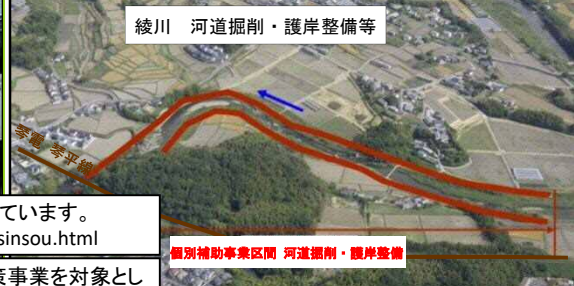
個別補助事業区間 河道掘削・護岸整備