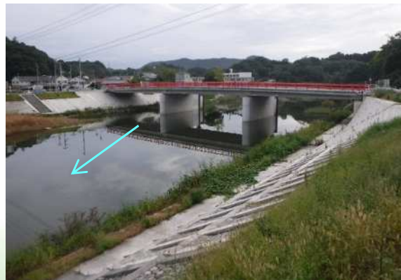
綾川 河川改修事業 【県】坂出市府中町(護岸整備等による河川改修)