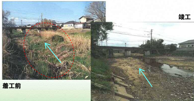
鴨部川 河道掘削事業 【県】さぬき市昭和(樹木伐採・河道掘削)