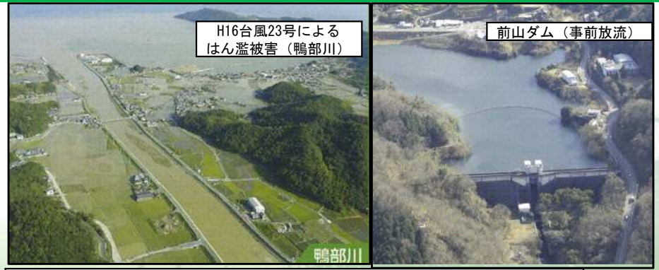
※本プロジェクトは、ブロック圏域内のあらゆる治水対策事業を対象としている。

※ 具体的な対策内容については、今後の調査・検討等により変更となる場合があります。