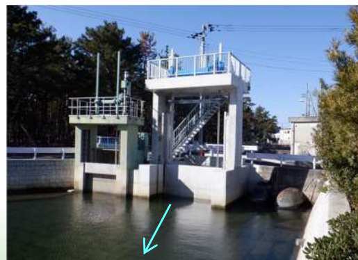
梅川 地震・津波対策海岸堤防等整備事業 【県】さぬき市津田町(津波・高潮対策)