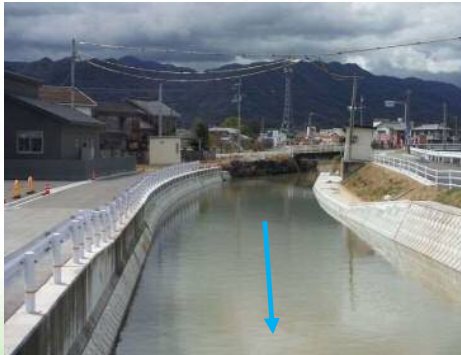
古川 河川改修事業 【県】東かがわ市引田(護岸整備等による河川改修)