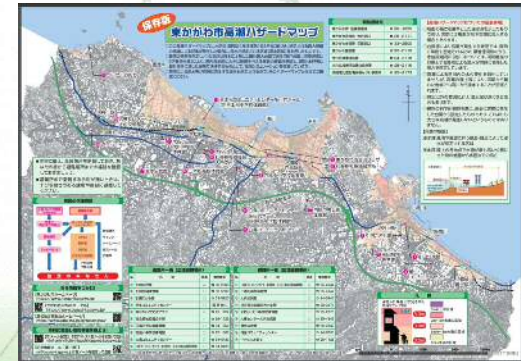
東かがわ市 ハザードマップの改良 【東かがわ市】