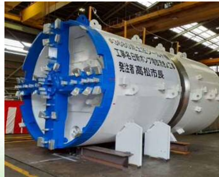
日新ポンプ場 大規模雨水処理施設整備事業 【高松市】高松市瀬戸内町（雨水排水施設の整備）