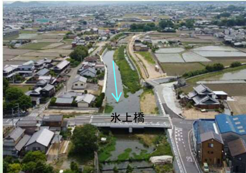
新川 河川改修事業 【県】三木町（護岸整備等による河川改修）