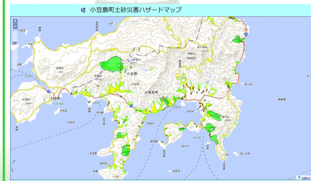
小豆島町 ハザードマップの改良 【小豆島町】