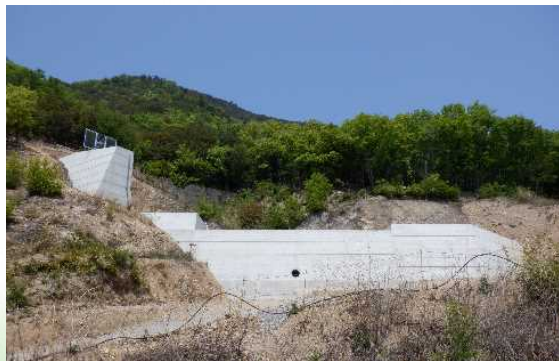
中条川 離島通常砂防事業 【県】小豆島町(砂防施設の整備等)