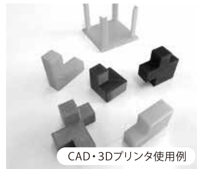
CAD・3Dプリンタ使用例