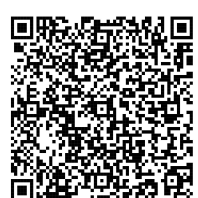
香川大学医学部附属病院 脳卒中・心臓病等総合支援センター