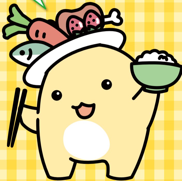
食品ロス削減推進キャラクター たるる