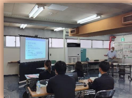
令和5年度セミナーの様子

(事業所の取組具合にもよりますが、例年、 最短で7ヶ月程度 で認証取得に至っています。)