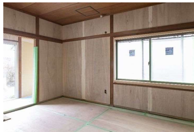
民間住宅の耐震診断、耐震改修工事